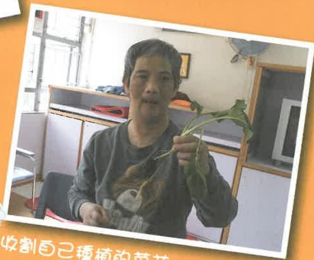
收割自己種植的菜芯