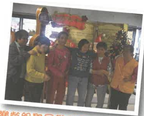
樂齡組學員與老友！