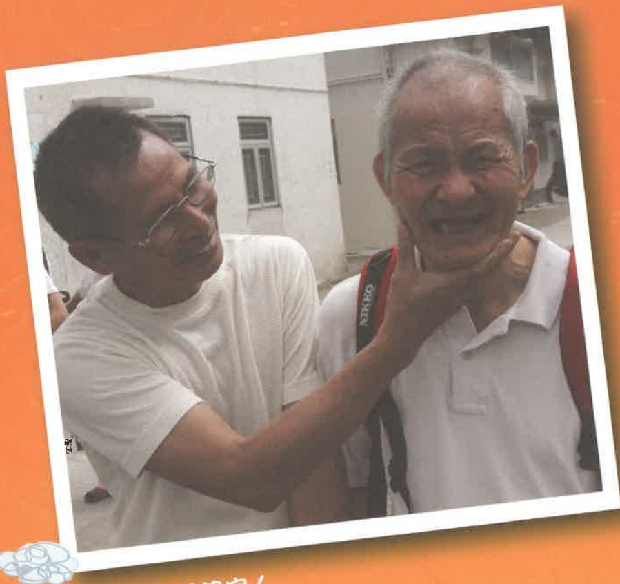
學員回家探望家人

部份學員之家人年老，未能經常安排他們回家渡假，但很多學員時常希望回家渡假而且很掛念家人，情緒容易受影響。中心可安排學員於早上回家，即日或翌日早上回中心。既可讓學員有機會回家，亦減低家人的照顧壓力。